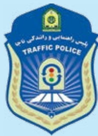
راهنمای رانندگی خراسان رضوی

بسیار واضح است آن چه که برای اتومبیل ها تصادف سطحی محسوب می شود، برای موتورسوار مرگ حتمی خواهد بود.