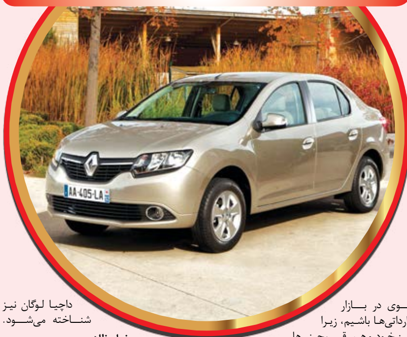
داجیا لوگان نیز شناخته می شود.

قوی در بازار وارداتی ها باشیم، زیرا این خودرو هم رقیب چینی ها محسوب می شود و هم کره ای و ژاپنی ها.