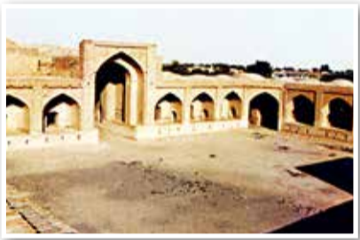
کاروانسرای روستای مزینان در شهرستان سبزوار

محمودرضا سلیمانی در گفت و گو با خبرنگار ما با بیان اینکه این آثار شامل کاروانسرای روستاهای مزینان، مهر، ریوند، سنک کلیدر، زعفرانیه، رباط شروش و صالح‌آباد، رباط شهر، خانه جعفرزاده، مصلی تاریخی و مناره خسروجرد است، افزود: کاروانسراهای تاریخی این منطقه دارای موقعیت جغرافیایی و بستر مناسب برای توسعه فضاهای پذیرایی و اقامتی بین راهی را دارند و با همین کاربری به مقاصضانب بخش خصوصی واگذار می‌شوند.