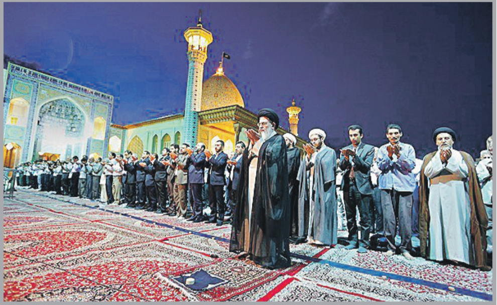
نماز طلب باران امروز در حرم حضرت احمد ابن موسی (ع) شاهچراغ امروز اقامه می‌شود

جاری برای انجام پروژه‌های مصوب نداریم و توجه به این مسأله از سوی مسؤولان کشوری و استانی ضروری است. وی ادامه