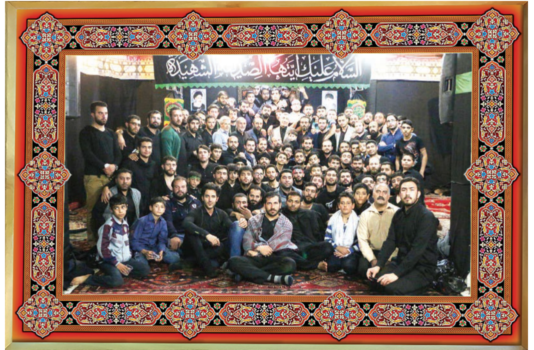
هیئت فاطمیون شهر الوند (استان قزوین)