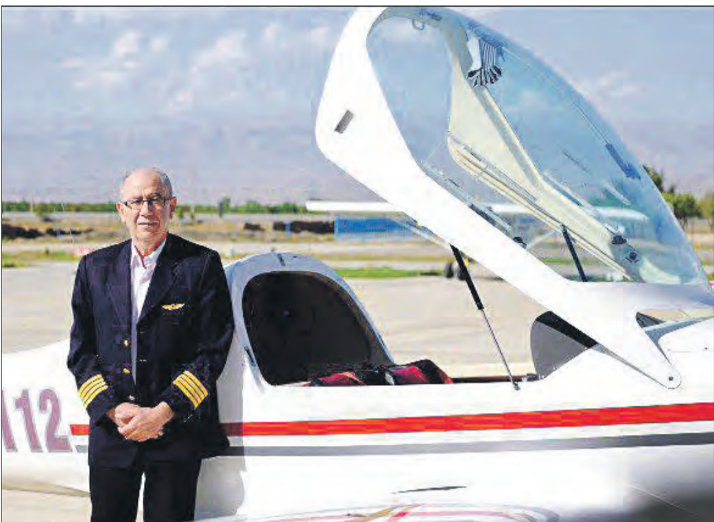
خلبانان باید به صورت معمول بین ۴ تا ۵۰۰۰ ساعت پرواز کنند تا بتوانند جای خلبان انجام وظیفه نمایند.

این‌ها خلبان و مریسی پرواز که هم اکنون در فرودگاه آموزشی تفریحی گلپنار مشهد مشغول آموزش خلبانی است به علاقه‌مندان این شغل توصیه می‌کند که حتماً قبل از ورود به این حوزه، با خلبانان دارای تجربه صحبت و مشورت کنند. او خاطر نشان می‌کند: زندگی یک خلبان، زندگی خاصی است و اگر شخصی بدون علاقه وارد این شغل شود، نمی‌تواند سستی‌های آن را تاب بیاورد.