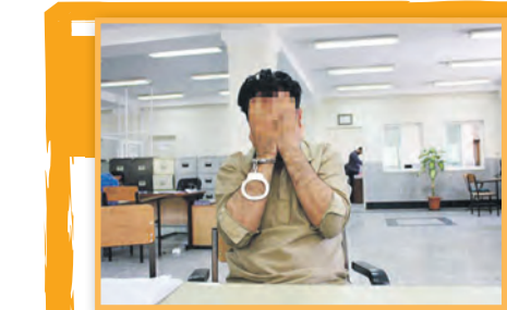
نصاب آسانسور در محل حادثه