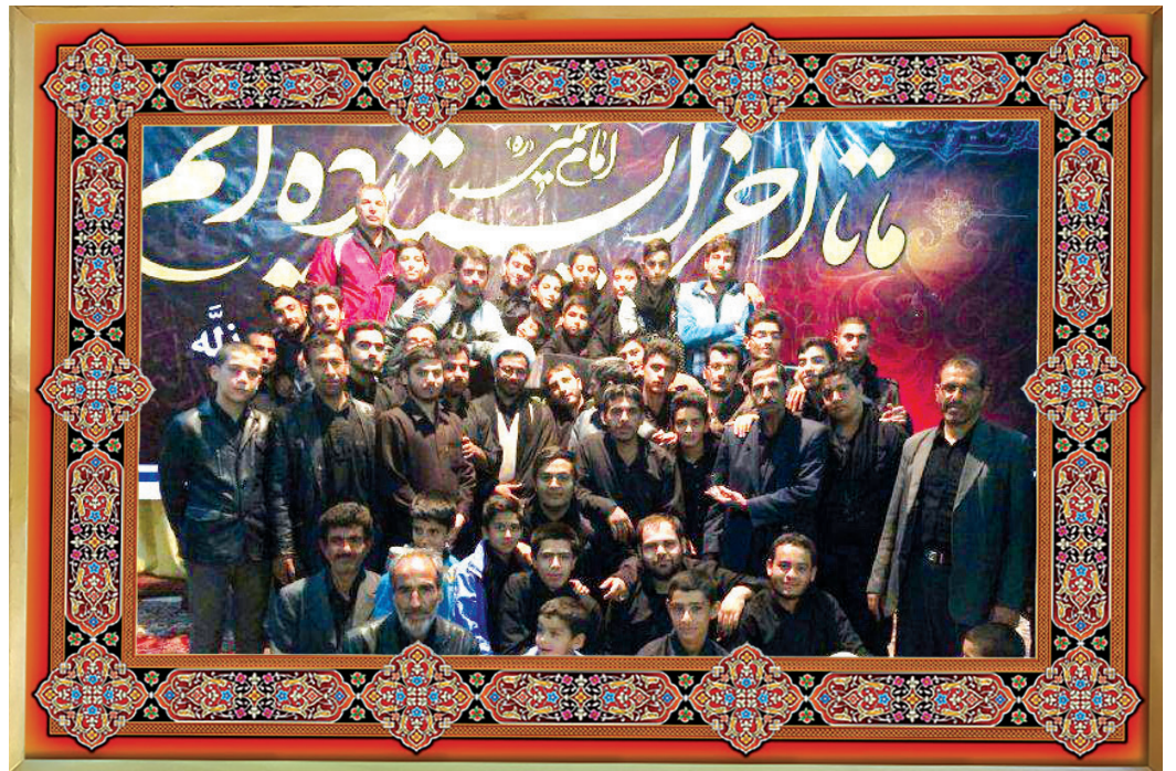
مجتمع فرهنگی مذهبی مسجد و حسینیه حضرت ابوالفضل (علیه السلام) روستای ایرج، هیئت انصار المهدی (علیهم السلام)

یکی از سنت‌های زیبای هیئت‌های قدیمی گرفتن عکس یادگاری با کتیبه و پرچم هیئت بوده که در این سال‌ها فراموش شده است. پیشنهاد می‌کنیم دست به کار شوید و پس از پایان مجلس تان یک عکس یادگاری دسته‌جمعی بگیرید و برای «چهارده» ایمیل کنید تا در همین صفحه منتشر شود. qudsonline14@gmail.com