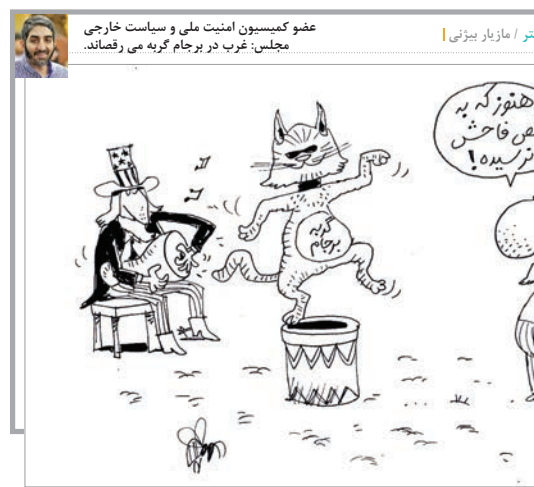
عفو کمیسیون امنیت ملی و سیاست خارجی مجلس: غرب در برجام گریه می رهماند.

چه امروز و چه چند ماه پس از برجام، «شرمن» اعتقاد دارد عملکردش در ماجرای توافق هسته‌ای عالی بوده است. به خاطر همین، حدود هشت ماه پس از برجام در نشست‌های «البرایت» و «بیکر» برگزار می شود با خوشحالی از مسائل جلو و پشت پرده توافق هسته‌ای حرف می زند: «... در مذاکرات هسته‌ای میان «اشتون» و جلیلی» ایران و ۵+۱ هر یک فقط حرف خودشان