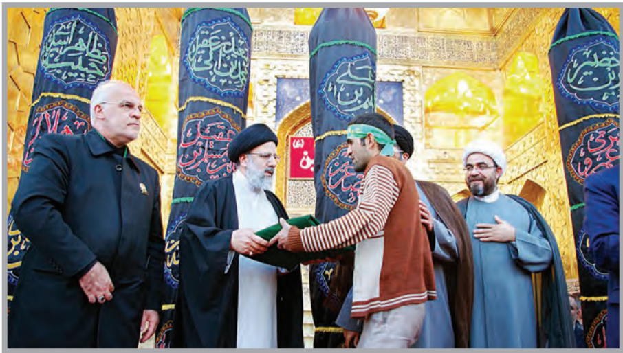
عکس علی کریمی هنگام مراسم تقدس

امیزان ، رئیس قوه قضائیه با تأکید بر ایستادگی دستگاه قضایی در مقابل همه‌ها و تخریب‌ها، گفت: بنیان احضارها و رسیدگی‌ها باید شرعی، قانونی وعادلانه باشد و پس از آن از هیچ گونه فشاری هراس نداشته باشید. آیت الله املی لاریجانی در جلسه مسئولان عالی قضایی با اشاره به سیاست‌های جدید