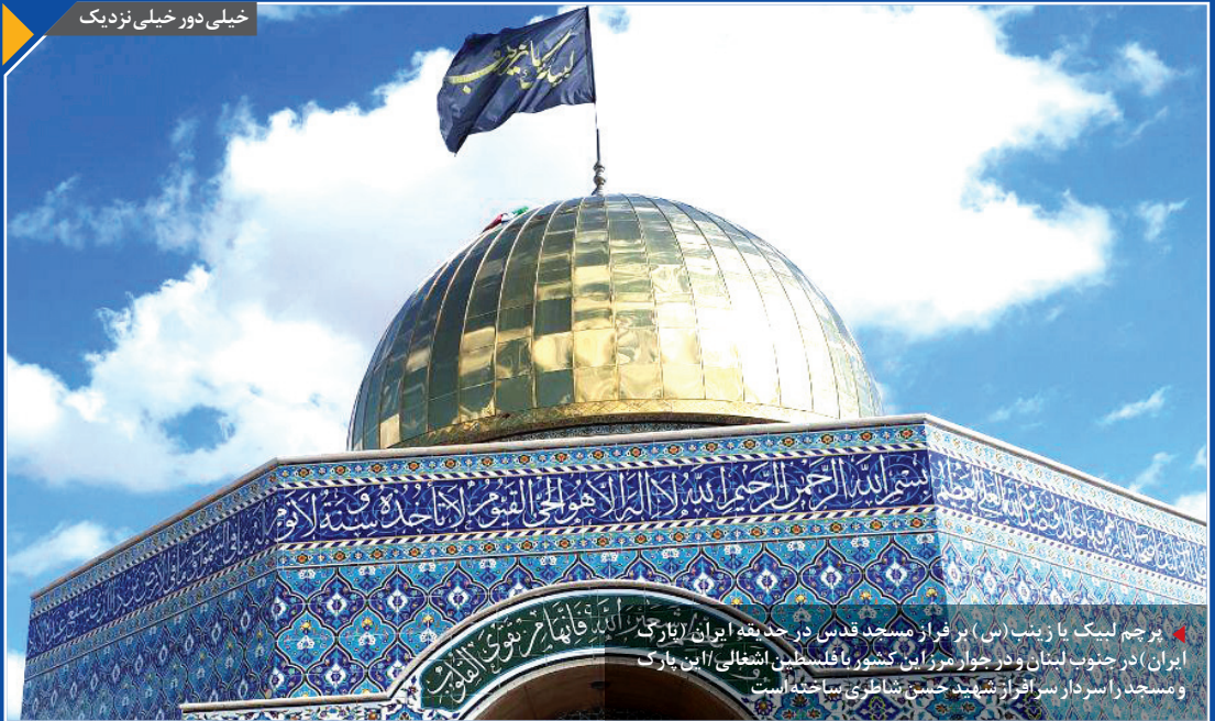
برجیم لبیک یا زینب (س) بر فراز مسجد قدس در حدیقه ایران (تارک ایران) در جنوب لبنان و در حوازی مرز بین کشور فلسطین اشغالی / این پارک و مسجد را سردار سراقه شهید جنگ شاطی ساخته است