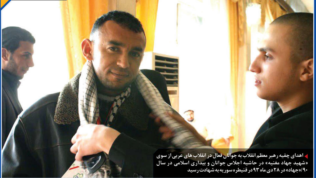
◀ اهدای جفیه رهبر معظم انقلاب به جوانان فعال در انقلاب های عربی از سوی «شهید جهاد مغنیه» در حاشیه اجلاس جوانان و بیداری اسلامی در سال ۹۰/ «جهاد» در ۲۸ دی ماه ۹۳ قتیطره سور به به شهادت رسید