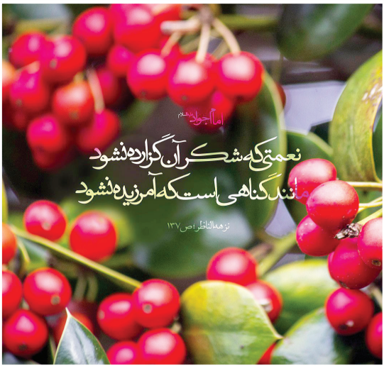
۱۳ مرداد ۹۶