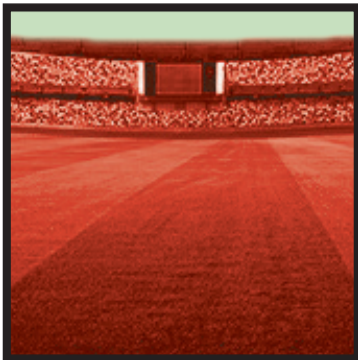
موجوداتی که ورزشکاران و سیاستمداران هم سراغش را می‌گیرند