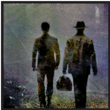
ماجرای تسخیر اجنه در گفت‌وگو با پژوهشگر ادیان