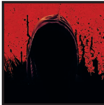
درباره دنیای اجنه و احضارشان و پرسش‌هایی که درباره این موجودات پنهان داریم