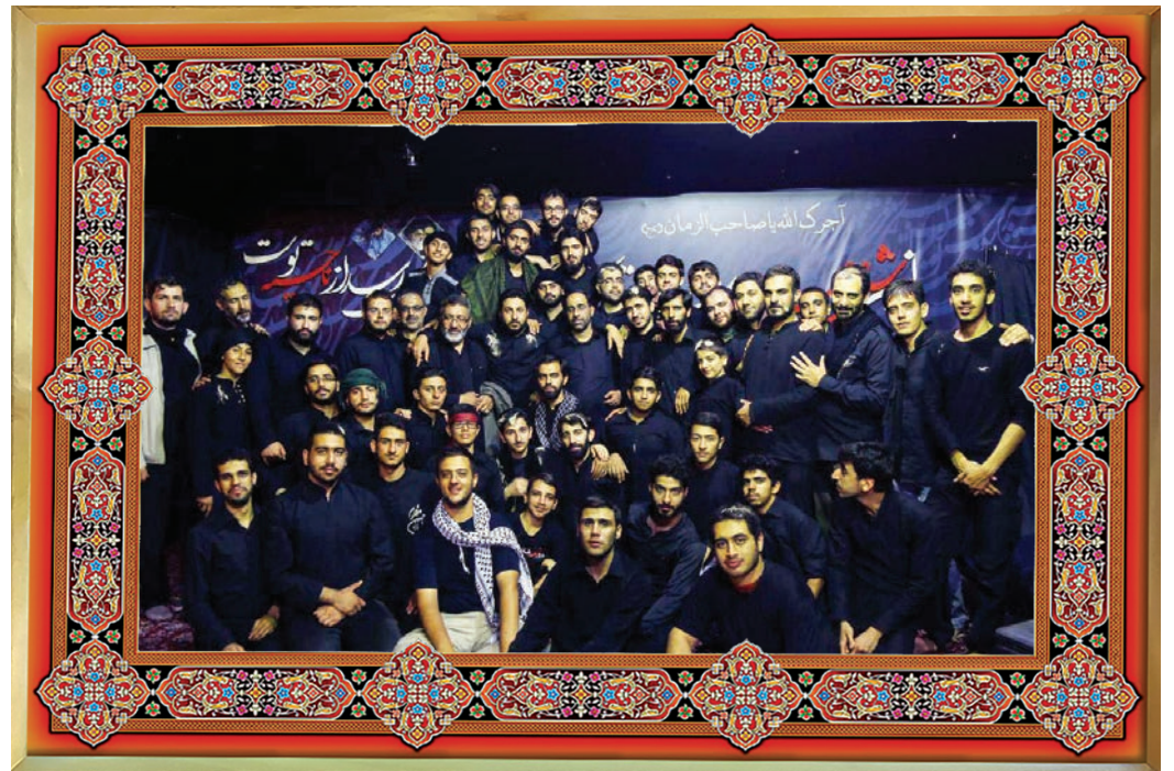
[ گردان فرهنگی سلمان / دارالولایه ]

هیئت ولایی چه هیئتی است و چه ویژگی‌هایی دارد آیا هیئتی که در آن فقط نام امام حسین (علیه السلام) و اهل بیت (علیهم السلام) برده می‌شود و در آن نکته‌ای از مسائل روز مطرح نشود، مورد تأیید ائمه است یا خیر؟ حواسمان باشد ائمه معصومین (علیهم السلام) دین و سیاست‌شان ممزوج بوده و حضور فعالانه در جامعه، نگاه امر به معروف و نهی از منکر، ایستادگی در مقابل ظالم و دفاع از مظلوم و حساسیت نسبت به ناهنجاری‌های اجتماعی، از سیره اهل بیت (علیهم السلام) است و باید این را جزء نگاه ولایی خود بدانیم. نگاه دیگری که در زمینه مجالس عزاداری ترویج می‌شود، این است که صرف سخن گفتن از امام حسین (علیه السلام) و نام بردن از مدافعان حرم و خوانده شدن شعری از دفاع مقدس و نصب عکس شهدا بر در و دیوار مجلس، آن را هیئت واقعی نمی‌کند. گرچه این موارد لازم است، اما آنچه اهمیت دارد این است که رفتار و سلوک عزاداران باید حکایت از همراهی با ولایت و اندیشه‌های ولایی رهبر معظم انقلاب باشد، به گونه‌ای که نظام و انقلاب بتواند در منصب‌های علمی و حساس به این هیئت‌ها تکیه کند. صرف عزاداری و ریختن اشک و دم زدن از شعارهای انقلابی، هیئت را به یک هیئت انقلابی تبدیل نمی‌کند؛ بلکه مجالس حسینی و هیئت‌ها نیازمند توانمندسازی اندیشه‌ها و الگوگیری از شهدا به‌صورت عملی و در نتیجه رشد انسان‌هاست.