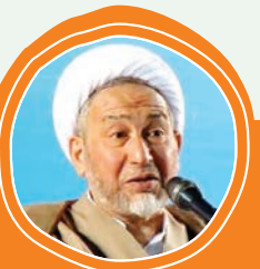
حجت‌الاسلام محمد تقی عبدوس