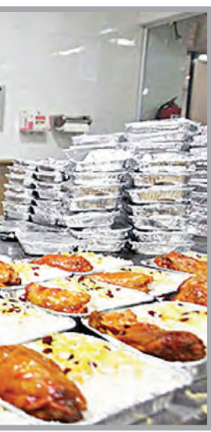
عکس تزئینی است

وی ادامه داد: ۳۰ تا ۴۰ مسجد نیز در کار پخت غذا وارد شده‌اند و زیرزمین مسجد را تبدیل به