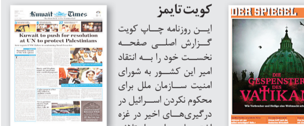
پیدشخوان / امیر محمد سلطان یور

کویت تایمز این روزنامه چاپ کویت گزارش اصلی صفحه نخست خود را به انتقاد امیر این کشور به شورای امنیت سازمان ملل برای محکوم نکردن اسرائیل در درگیری‌های اخیر در غزه اختصاص داده و از تلاش