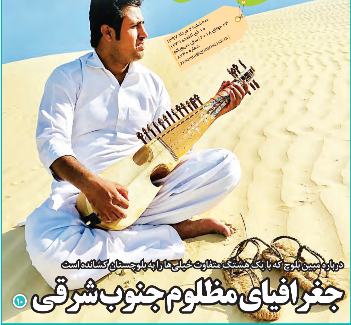
درباره مبین بلوچ که با یک هشتک متفاوت خیلی‌ها را به بلوچستان کشانده است