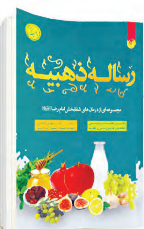
کسب حلال از جهت که به رزق و روزی

جمله معروف امام حسین(ع) در روز عاشورا خطاب به سپاه کوفه که برای کشتن او گرد آمده بودند، بیانگر این واقعیت است؛ وقتی امام برای هدایت و پند و اندرز آنان برآمد، غوغا کردند تا صدای پند امام به گوش آن‌ها نرسد، به آنان فرمود: «شکم‌های شما از غذای حرام اشباع شده، خون، پوست و گوشت شما از این لقمه‌های حرام به وجود آمده دیگر امیدی به هدایت شما نیست». بنابراین آلودگی روح متأثر از آلودگی جسمی و تغذیه است؛ از این رو سسزوار است انسان برای