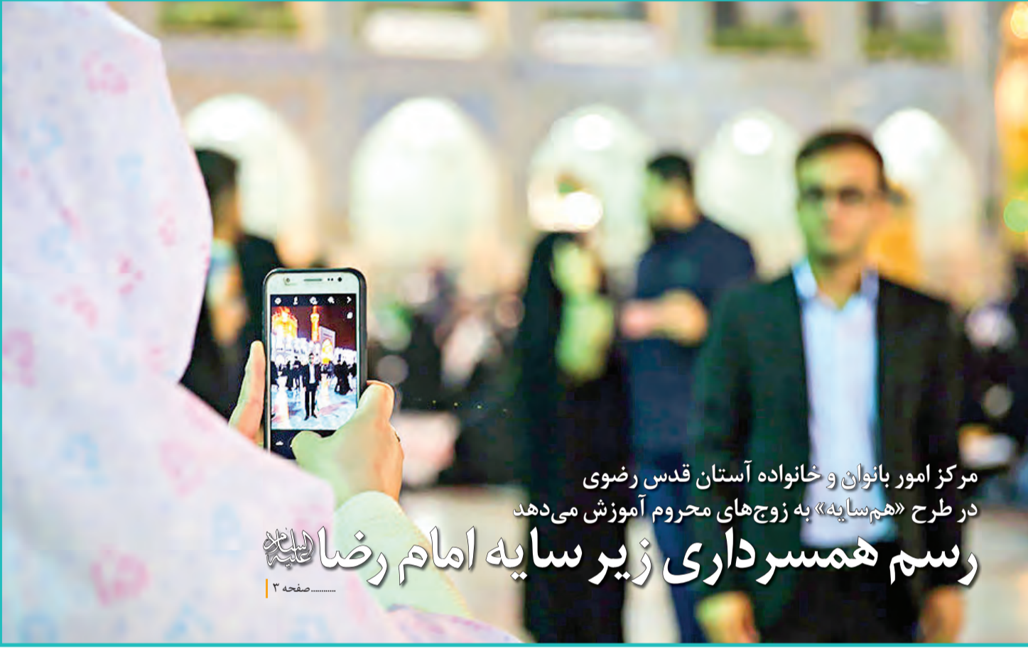
مرکز امور بانوان و خانواده آستان قدس رضوی در طرح «هم‌سایه» به زوج‌های محروم آموزش می‌دهد رسم همسر داری زیر سایه امام رضا علیه السلام