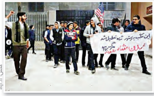
نمایی از بازسازی بخشی از حوادث انقلاب مشهد در جریان بازدید دانش‌آموزان مدارس امام رضا(ع) از موزه زنده زیارت در مشهد

تشریف ۶۰۰۰ دانشجوی زیارت اولی به حرم تا پایان سال آستان: به همت مؤسسه جوانان آستان قدس رضوی، در دو تفاهنامه مجزا با نهاد مقام معظم رهبری در دانشگاه‌ها و معاونت فرهنگی و اجتماعی وزارت علوم، تحقیقات و فناوری تا پایان سال ۶۰۰۰ دانشجوی زیارت اولی به مشهد مقدس مشرف خواهند شد. تاکنون در مجموع افزون بر ۱۵۰۰ دانشجوی زیارت اولی طبق این تفاهنامه‌ها به حرم مطهر رضوی مشرف شده‌اند. بنا به این تفاهنامه‌ها برگزار می‌کنند کلاس‌های معرفتی و تأمین ۹ وعده غذایی در هر دوره سه روزه بر عهده مؤسسه جوانان آستان قدس رضوی قرار گرفته است.