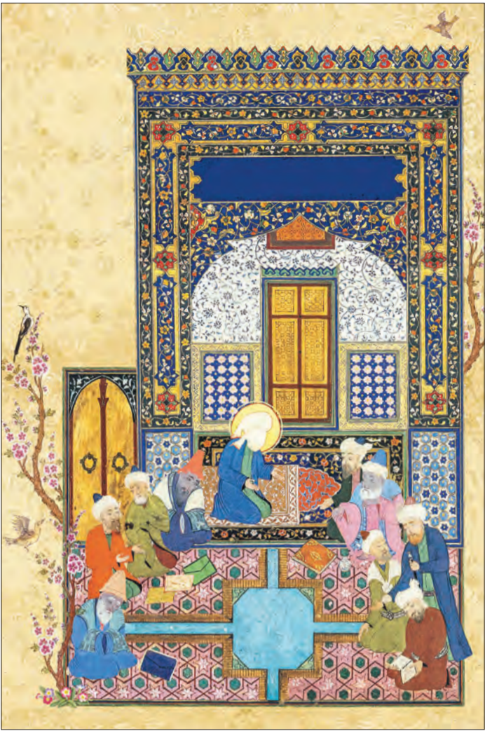
طرح: khamenei.ir «امام جواد(ع) متفکر بزرگ آید اجتماعی»

او به اشراف ائمه(ع) به علوم غیردینی نیز اشاره