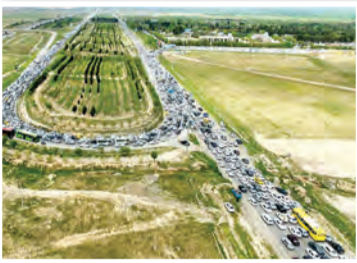
تصویری از تیر افک آیین چراغ برات در مسیر بهشت رضای

ابوالحسن صاحبی: ایرانیان از دیرباز برای اموات خود احترام و قداست خاصی قائل بوده و هستند و سعی کرده‌اند که به نوعی روح آنان را از خود شاد و راضی و یاد آنان را گرمی نگه دارند و به همین سبب هویت و زندگی هر ایرانی از هر قوم و قبیله‌ای که باشد به صورت کاملاً در هم تنیده با گذشته و میراث گذشتگانش گره خورده و بر همین اساس مردم خطه خورشید هم مراسم خاص خود را دارند که یکی از آنان «مراسم چراغ برات» است.