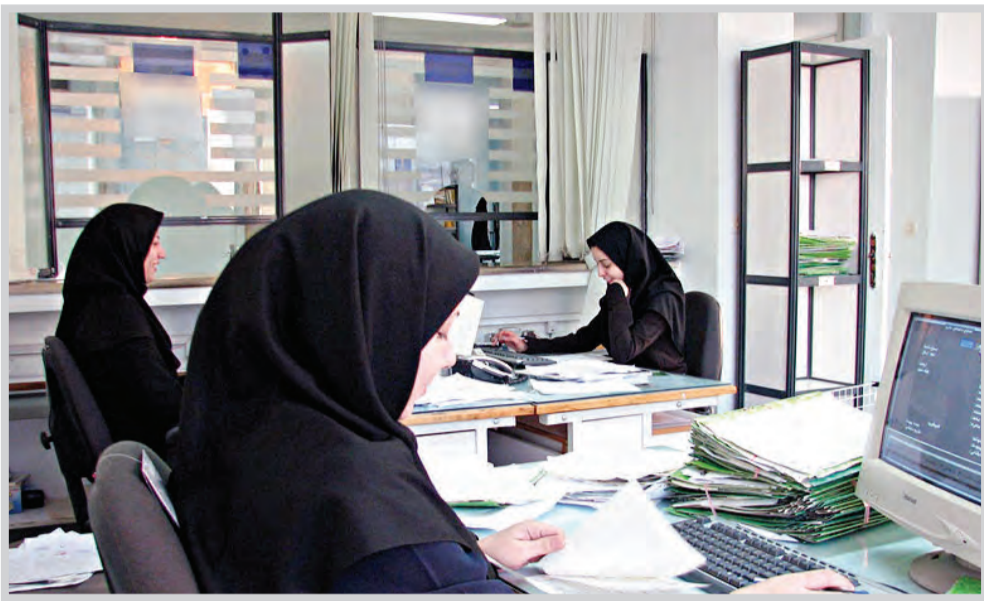
عکس تازینبی است

وی خاطر نشان کرد: در حال حاضر در پارک علم و فناوری حدود ۴۳۰۰ نفر فعال که ۸۵ درصد آن‌ها لیسانس به بالا هستند که این قضیه در رشد فعالیت‌های این حوزه قابل تأمل است. بخصوص آنکه در مراکز دانشگاهی استان خراسان رضوی همانند دانشگاه فردوسی و دانشگاه آزاد اسلامی با وجود تلاش‌هایی نظیر ایجاد کانون کارآفرینی، به تغییر مفهوم نخبگی توجه کرده‌اند. رئیس پارک علم و فناوری خراسان رضوی با اشاره به