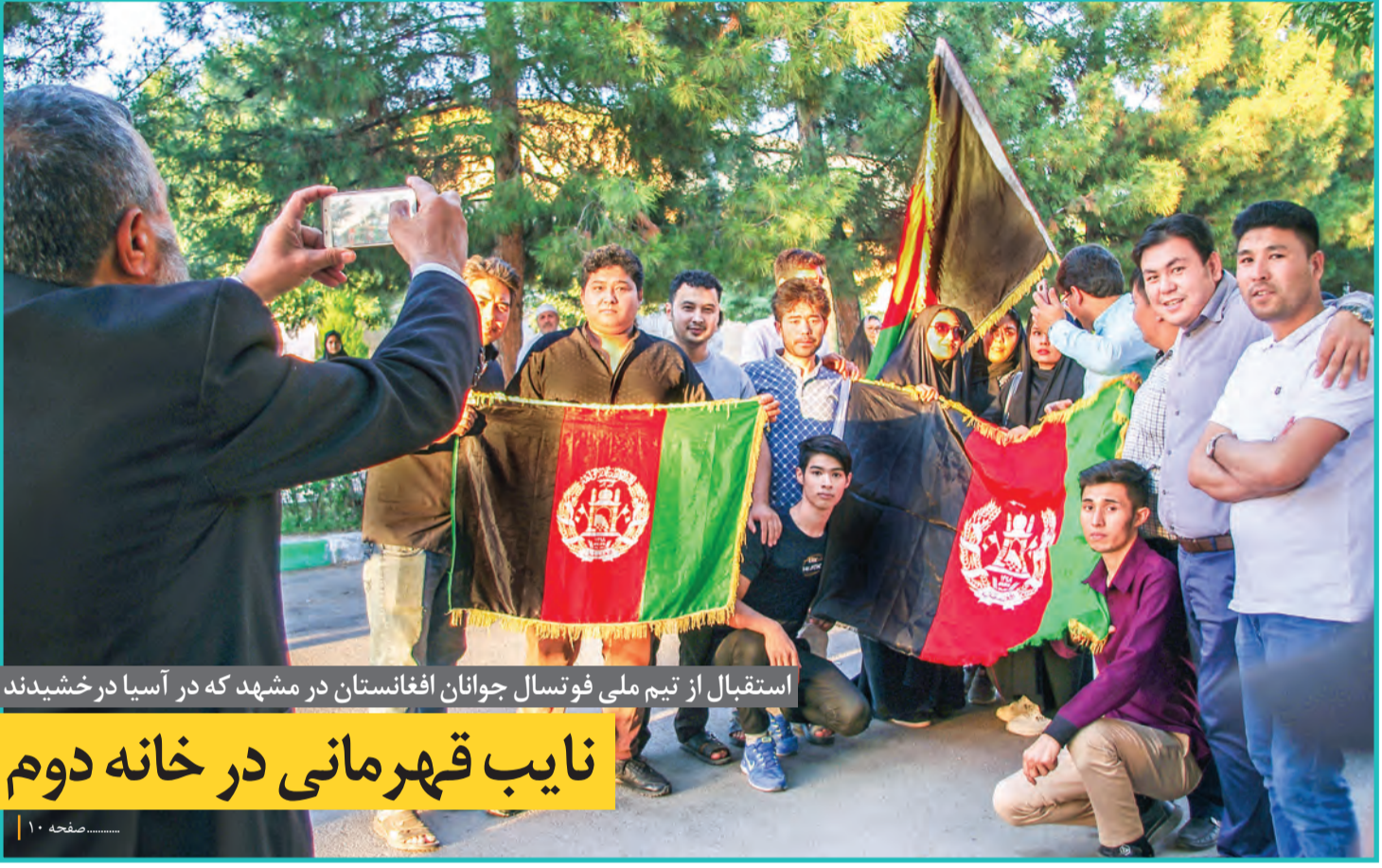
استقبال از تیم ملی فوتبال جوانان افغانستان در مشهد که در آسیا درخشیدند