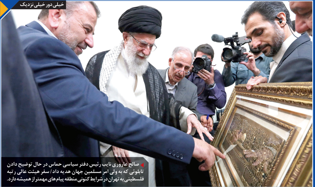
صالح عاروری نایب رئیس دفتر سیاسی حماس در حال توضیح دادن تابلویی که به ولی امر مسلمین جهان هدیه داد / سفر هیئت عالی رتبه فلسطینی به تهران در شرایط کنونی منطقه پیام‌های مهم‌تر از همیشه دارد.