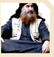
کشف مخفیگاه جدید البغدادی در سوریه

مدیر اطلاعات و مبارزه با تروریسم عراق عنوان کرده است: "ابوبکر البغدادی در حال حاضر در یک منطقه در غرب سوریه قرار دارد. ابوعلی البصری خاطر نشان کرد: تعدادی از رهبران داعش با دستور مستقیم البغدادی به ترکیه و شمال آفریقا گریختند. البغدادی چند روز پیش صوت جدیدی را پخش کرده است که اعضای آن را به نجات داعشی‌ها و خانواده‌های آنها که در زندان‌ها و اردوگاه‌ها دستگیر شده‌اند، فراخوانده است و همچنین به طور غیرمستقیم از آرامش هواداران خود ابراز رضایتی کرد.