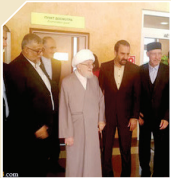
برگزاری همایش «اسلام در جهان فراگیر» در مسکو

همایش اسلام در جهان فراگیر از دوشنبه در مسکو آغاز می‌شود. آیت‌الله «محمد علی تسخیری» عضو شورای عالی مجمع جهانی اهل بیت (ع) و مشاور مقام معظم رهبری و «ابوذر ابراهیمی ترکمان» رئیس سازمان فرهنگ و ارتباطات اسلامی برای شرکت در نشست گفت‌وگوهای فرهنگی ایران و روسیه که قرار است در مسکو برگزار شود راهی روسیه شدند. مسئولان ایران قرار است دوشنبه همراه در «هفتمین گردهمایی سراسری مسلمانان روسیه» که به دعوت روابیل عین‌الدین رئیس شورای مفتیان روسیه و با حضور هیات‌های عالی‌رتبه خارجی برگزار خواهد شد، شرکت کنند. این گردهمایی قرار است در بزرگترین مسجد مسکو با عنوان جامع برگزار شود.