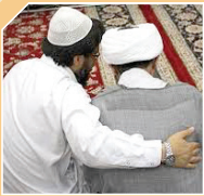
برگزاری مسابقه وحدت شیعه و سنی در افغانستان

مسابقه بزرگ اخوت به مناسبت میلاد پیامبر بزرگ اسلام و هفته وحدت با حضور بیش از ۴ هزار شرکت کننده از میان دانشجویان، طلاب و خواهران و برادران اهل تشیع و اهل سنت، از سوی شورای اخوت اسلامی بلخ، در مسجد جامع روضه حضرت علی (ع) شهر مزارشرف برگزار شد. در این مسابقه چهل سوال از منابع اهل سنت و تشیع همراه با پاسخ‌های آن طرح گردیده بود که از میان آنها ۱۰ سوال در امتحان استفاده شده بود. این در حالی است که جزوه‌های این مسابقه، دو هفته قبل در تمام مکان‌های عمومی توزیع شده بود و کسانی که آن جزوات را تهیه کرده بودند می‌توانستند در مسابقه شرکت کنند. علما و سخنرانان این مسابقه عم از شورای اخوت اسلامی و شورای علمای بلخ ضمن اینکه برگزاری این مسابقه را حرکتی در مسیر وحدت هر چه بیشتر میان مذاهب اسلامی در بلخ دانستند، خاطر نشان کردند که هفته وحدت هفته اخوت و همدلی میان مذاهب اسلامی می‌باشد و جامعه اسلامی را بیش از گذشته به یکدیگر نزدیک می‌کند.