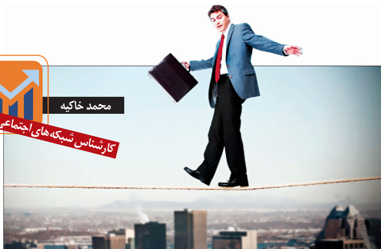
کارشناس شبکه های اجتماعی

موقعیت مکانی قابلیت که اینستاگرام برای صفحه ها قرار داد که از طریق آن کاربران می توانند که در پست هایشان موقعیت فیزیکی شان را ذکر کنند، در این صورت پست آن ها در پست های آن موقعیت مکانی خاص نمایش داده می شود، در ادامه مطلب نحوه استفاده مفید از این قابلیت اینستاگرام را توضیح می دهیم. صفحه هر موقعیت مکانی در اینستاگرام درست مثل صفحه هشتگ ها رفتار می کند و هر پستی که با آن موقعیت مکانی خاص منتشر شود در صفحه آن موقعیت مکانی نمایش داده نمی شود و این صفحه دارای دو بخش (برترین ها) Top (جدیدترین ها) است، و جوه تمایز صفحه موقعیت مکانی با صفحه هشتگ نبود استوری و قابلیت دنبال کردن در صفحه های موقعیت مکانی است. نکته مهم دیگر در مورد موقعیت مکانی اینکه لزومی ندارد