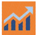
آرزش زمانی روزنامه نگار

برندهای لوکس بر مبنای درک انحصار، تأکید دائمی بر موفقیت خود به عنوان یک نخه و نیروی آرمانی رشد می کنند. از استاد سوئیس ساعت ساز Patek Philippe تا بهترین تولید کننده ماشین Koenigsegg و تا Rolls-Royce ساخت انگلیس، انحصار یک زمینه استوار است. Rolls-Royce بیش از ۲۰۰۰ ماشین در سال تولید نمی کند که همه آنها سفارشی است و کارشان با دست تمام می شود. خرید از این برندها به مشتریان اجازه می دهد که بخشی از دنیای آنها بشوند و احساس کنند که به یک انجمن منحصر به فرد تعلق دارند که بروزی از شخصیت و سلیقه آنهاست. برای ایجاد انحصار، به دعوت از مشتریان انتخابی برای رویدادهای VIP انحصاری، برپا کردن عضویت های VIP مبتنی بر دعوت یا پیشنهاد دسترسی انحصاری به اجرای محدود و محصولات سفارشی توجه داشته باشید.