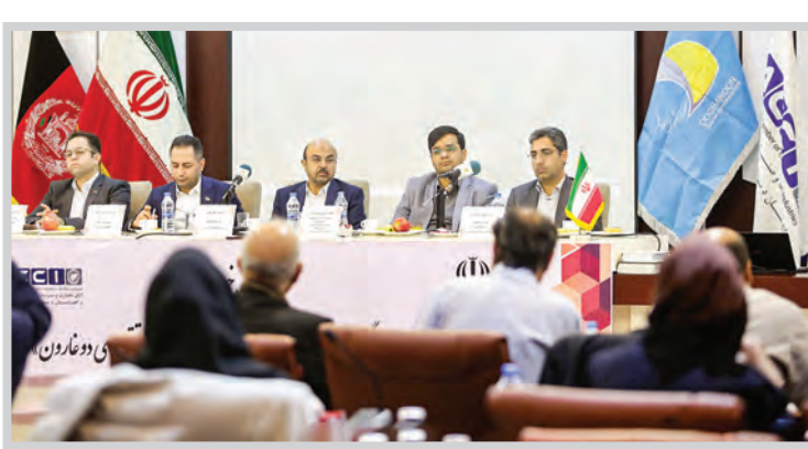
معاون هماهنگی امور اقتصادی استاندار خراسان رضوی به همکاری‌های مثبت بخش خصوصی در سال‌های گذشته اشاره کرد و افزود: یکی از بهترین مسیرهای سرمایه‌گذاری، دو منطقه ویژه

سرپرست مخابرات خراسان رضوی در گفت‌وگو با قدس: