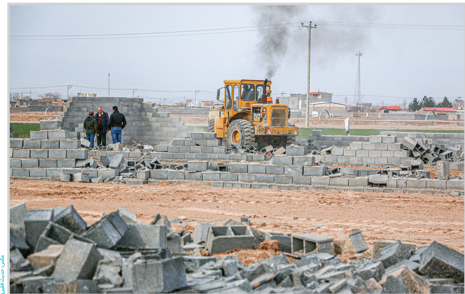
عکس خبری تقدیمی