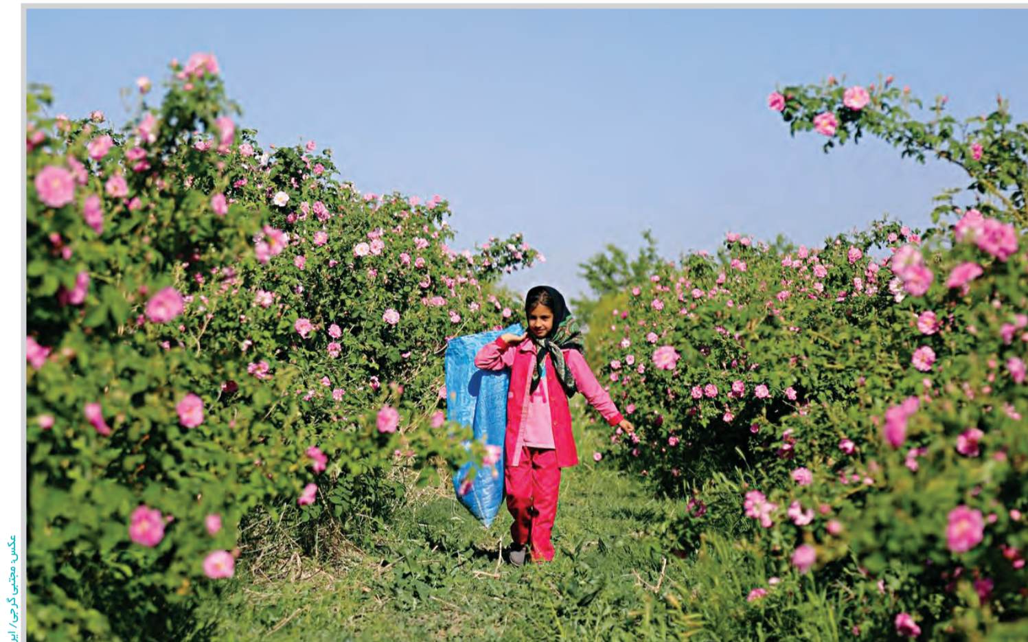
نخمس موقوفه فدک/ کرجی/ ایران

قدس: با شکفتن گل‌های محمدی در فصل بهار برداشت این گل از مزارع موقوفه فدک بیرجند توسط کشاورزان آغاز شد. مزرعه فدک قسمتی از موقوفه شوکت‌آباد در نزدیکی بیرجند است که عواید حاصل از فروش محصولات کشاورزی آن در توسعه فعالیت‌های قرآنی و برگزاری مراسم عزاداری اهل بیت(ع) و سایر نیت‌ها در حوزه معارف صرف می‌شود. پیش‌بینی می‌شود حدود ۲۵ تن گل محمدی از این مزارع برداشت شود که درآمد حاصل از فروش آن صرف امور مربوط به نیت‌های واقفان می‌شود.