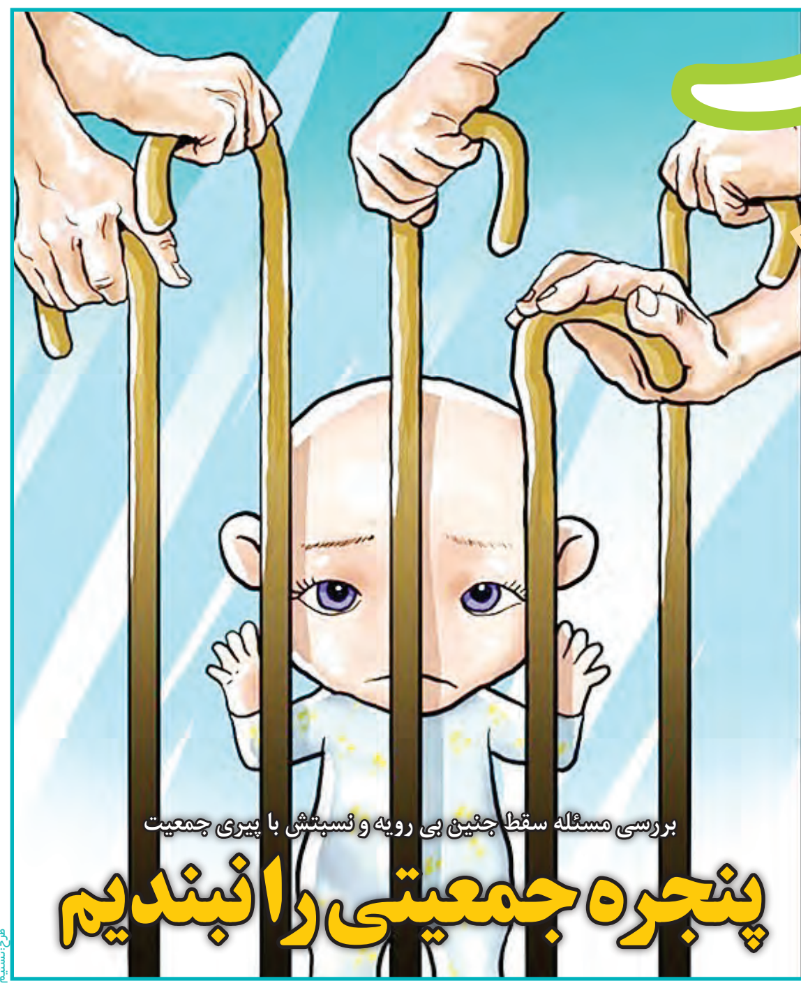
بررسی مسئله سقط جنین بی رویه و تسلیت با پیری جمعیت