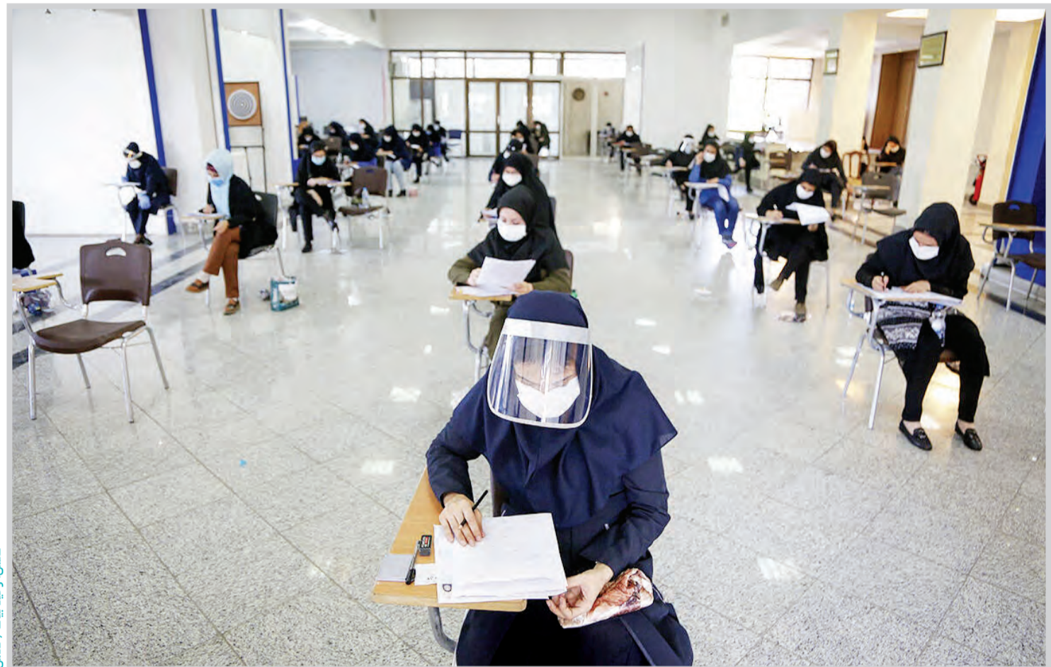
کنکور وحید نیابت / قدس