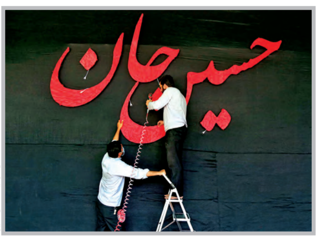
حسین - وجد علی خلیلی / ایرنا

قدس: از سال گذشته با شیوع بیماری کرونا سبک جدیدی بر زندگی و آداب و رسوم انسان‌ها حاکم شده که برپایی مجالس عزاداری برای سرور و سالار شهیدان نیز از این قاعده مستثنا نیست. با وجود محدودیت‌های اعلام شده و خوشحالی دشمنان اسلام برای کم رنگ شدن این آیین مذهبی، نتهتا از شور حسینی در مجامع مختلف کم نشده بلکه امسال شعور حسینی نیز با این شور زایدالوصف جلوه‌ای وصفناپذیر در برپایی مراسم سوگواری به نمایش گذاشته است.