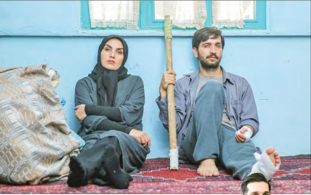
سریال «زمین گرم» به دلیل حساسیت‌های بالایی

به هر حال هر بازیگری دوست دارد نقش‌های متفاوتی را تجربه کند و من هم از این ماجرا مستثنا نیستم.