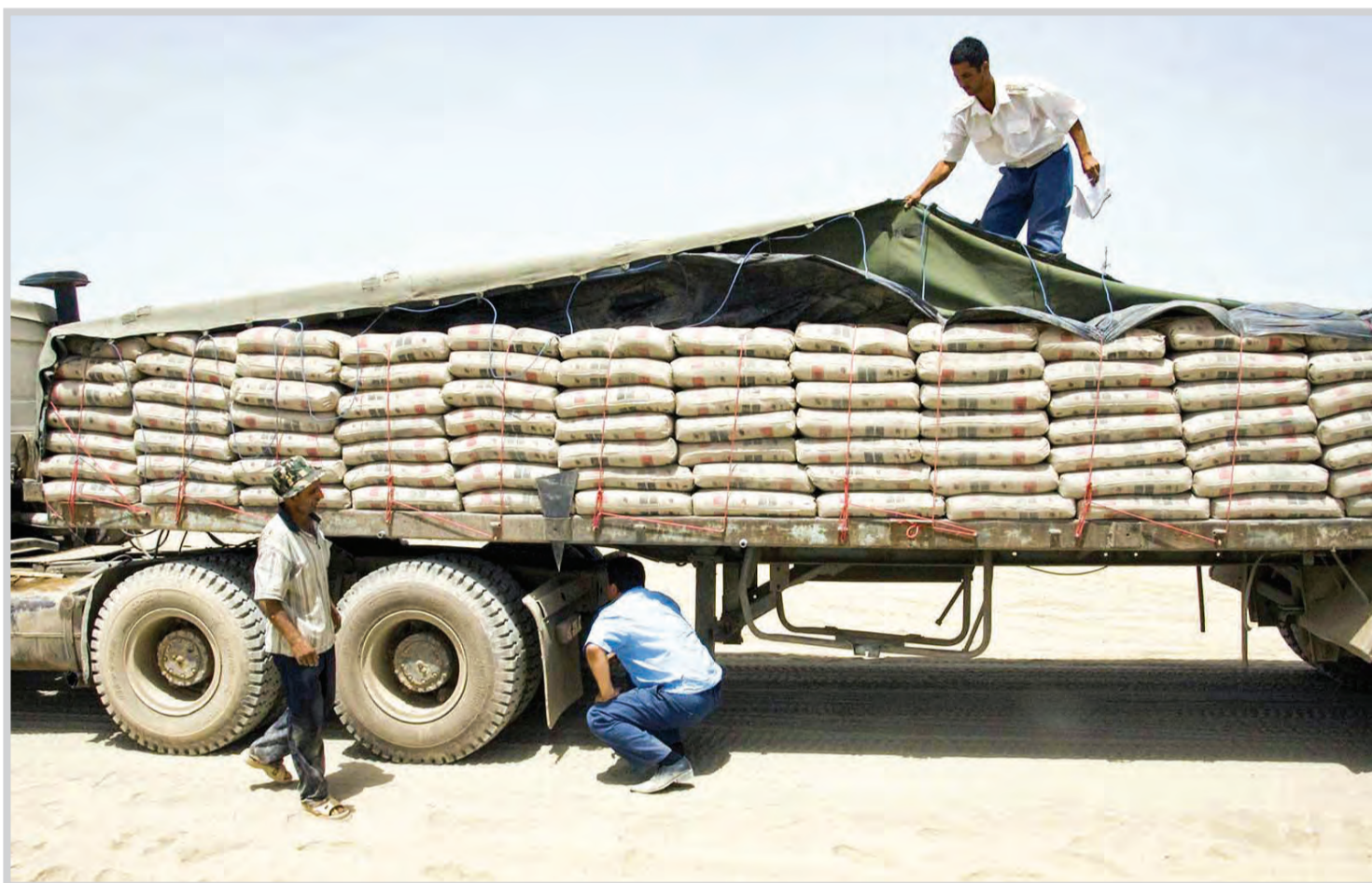
عکس: تهرانی است

بستری روزانه ۱۷۰ بیمار جدید در بیمارستان‌ها