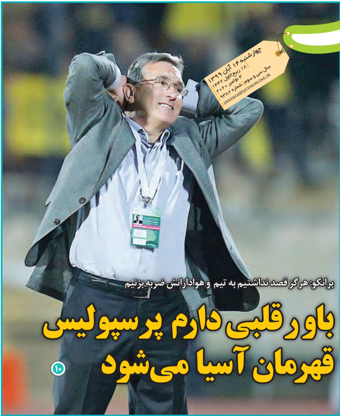
برانکو: هرگز قصد نداشتیم به تیم و هوادارانش ضربه بزنیم