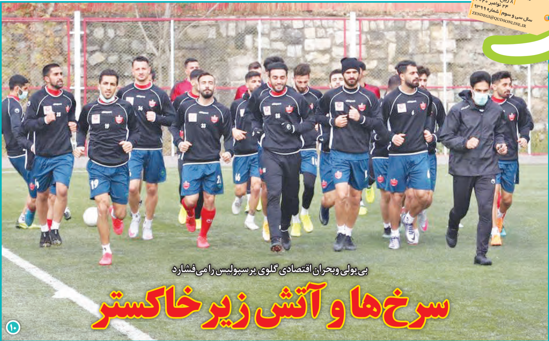
بی‌پولی و بحران اقتصادی گلوی پرسپولیس را می‌فشارد

شماره ۴ آذر ۱۳۹۹ ۸ ربیع الثانی ۱۴۴۲ ۲۴ تومار ۲۰۲۰ سال سی و سوم | شماره ۹۳۹۹ ZENDEGI@QUDSONLINE.IR