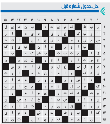
منتظر نظرها، دیدگاه‌ها و انتقادها تان در خصوص جدول هشتم یا ما تماس بگیرید