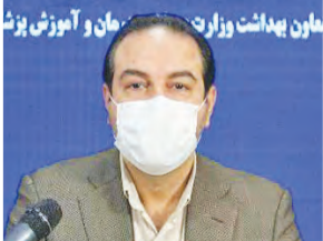
معاون بهداشت وزارت بهداشت و درمان و آموزش پزشکی

سخنگوی ستاد ملی مقابله با کرونا گفت: ترددها و سفرها در زمینه انتشار ویروس کرونا بسیار مؤثر است و حتی سفرهایی که هفته گذشته به جزیره قشم اتفاق افتاد، جای نگرانی دارد؛ زیرا این رعایت‌نکردن می‌تواند موجب افزایش موارد ابتلا و مرگ و میر به علت کرونا شود. دکتر علیرضا رئیسی درباره مدارس نیز افزود: مدارس به هیچ وجه به صورت اجباری بازگشایی نخواهد شد و اختیاری خواهد بود. در شهرهای رزد و آبی برای کلاس‌های اول و دوم، خانواده‌ها می‌توانند تصمیم بگیرند. اما حضور کادر مدرسه با خود مسئولان آموزش و پرورش است. وی در گفت‌وگو با ایرنا با پاسخ به این پرسش که آیا ممکن است کشور ما هم دچار موج جدید و کشنده کرونا همان‌طور که اکنون در اروپا و آمریکا شاهدیم شود؟ گفت: وضعیت بیماری کووید ۱۹ در کشور به گونه‌ای است که از نظر تعداد بستری و