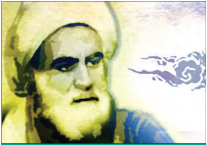
علامه حلی هم از جمله دانشمندان و فقیهانی است که پشت در پشت، عالم بوده‌اند. «یوسف بن مطهر» از جمله عالمان علم اصول در شهر «حله» بود و برای خودش شهرت و اعتباری داشت. برای همین از کودکی آموزش علوم به فرزندش را به عهده گرفت.

علامه حلی بعدها به دعوت سلطان محمد خدابنده به ایران می‌آید و سال‌ها در کشورمان زندگی می‌کند. البته پس از مرگ سلطان محمد خدابنده به حله برمی‌گردد و دیگر سفر نمی‌کند تا اینکه کمی پیش از ۸۰ سالگی از دنیا می‌رود. حکایت دیدار او با امام زمان (عج) از جمله حکایت‌های جالب است که به عنوان حسن‌ختم مطلب می‌خوانید: «هر شب جمعه از حله به کربلا می‌رفت. شب را در حرم می‌ماند و روز بعد به شهر حله برمی‌گشت. در یکی از سفرها در راه شخصی به او رسید و با هم روانه کربلا شدند. خیلی زود بحث علمی میانشان گرم شد و علامه فهمید با مردی بزرگ همصحبت شده است به طوری که می‌داد، تا آنکه در مسئله‌ای، آن شخص برخلاف فتوای علامه فتوا داد. علامه گفت: این فتوای شما برخلاف اصل و قاعده است؛ دلیلی هم که این قاعده را از بین برد نداریم. آن شخص گفت: چرا دلیل موثقی داریم که شیخ طوسی در کتاب تهذیب در وسط فلان صفحه آن را نقل کرده است. علامه حلی گفت: چنین حدیثی را در کتاب تهذیب ندیده‌ام. آن شخص گفت: کتاب تهذیبی که پیش تو هست در فلان صفحه و سطر این حدیث نوشته شده است... در این موقع عصایی که در دست داشت به زمین افتاد. همزمان هم از آن شخص پرسید که آیا در زمان غیبت کبری، امکان ملاقات با امام زمان (عج) هست؟ آن شخص تازیانه را برداشته بود و به علامه می‌داد و وقتی دستش به دست علامه رسید، فرمود: چگونه نمی‌توان امام زمان را دید در صورتی که اینک دست او در دست توست؟