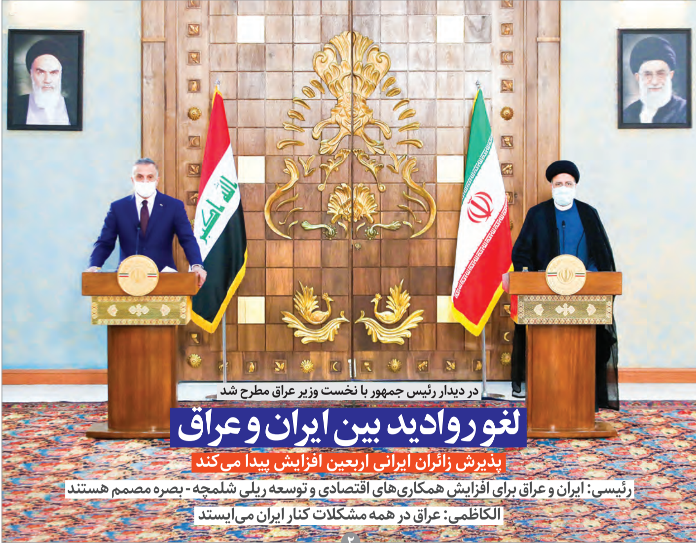
در دیدار رئیس جمهور با نخست وزیر عراق مطرح شد