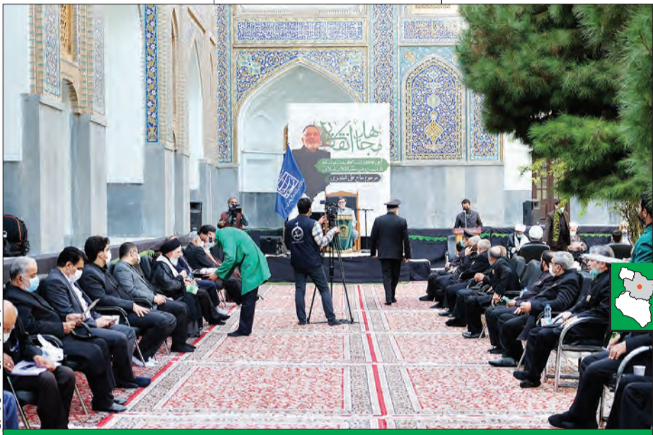
آیت‌الله علم‌الهدی: مایه تأسف است که افرادی مانند مرحوم شمعقدری با این همه فداکاری، یک به یک از دنیا می‌روند و خاطرات آن‌ها دفن می‌شود و ما تاکنون نتوانسته‌ایم ولایایی بودن و عمل‌گرایی آن‌ها را به نسل امروز منتقل کنیم.

اگر رسیدگی نکنیم، جریان‌های شیطانی و غریزه آن‌ها را از ما جدا می‌کنند. وی متذکر شد: در کتاب‌های درسی آموزش و پرورش آثاری نیست که طاغوت‌شناسی و بسترشناسی انقلاب و موقعیت‌های خاصی را که انقلاب ظهور و بروز داشت، برای