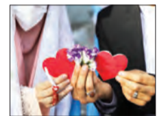
ما مشهدهای یک رسم قدیمی جالب و شیرین داریم و آن هم «عقد بالای سر حضرت» است. برای همین نیز شما هر روز که به حرم مطهر بروید اگر گذرستان به

رواق شیخ طوسی واقع در دارالحججه بیفتد قطعاً زوج های جوان و خانواده هایشان را خواهید دید که مراسم عقد را در جوار بارگاه حضرت رضا(ع) برگزار می کنند. البته قرار نیست در این مطلب مختصر و خیرگونه، تاریخچه این رسم را بنویسیم و بگوییم از چه زمانی آغاز شد. می خواهیم بگوییم این فقط زوج های جوان مشهدهی، مجاوران و خانواده هایشان نیستند که دوست دارند به نیت تبرک مراسم عقد و آغاز زندگی مشترک را در مکانی مقدس برگزار کنند. دیروز خبرگزاری «مهر» نوشت مراسم عقد زوج های جوان همزمان با فرارسیدن هفته وحدت و ولادت پیامبر مکرّم اسلام (ص) و امام جعفرصادق (ع)، در اتاق عقد آستان مقدس حضرت عبدالعظیم (ع) با رعایت نامه های بهداشتی برگزار می شود. روابط عمومی آستان مقدس حضرت عبدالعظیم (ع)، اعلام کرده است مراسم عقد زوج های جوان همزمان با فرارسیدن هفته وحدت و ولادت پیامبر مکرّم اسلام (ص) و امام جعفرصادق (ع)، در اتاق عقد آستان مقدس حضرت عبدالعظیم (ع) با رعایت شیوه نامه های بهداشتی برگزار می شود. همزمان با این ایام پربرکت، بیش از ۵۰ زوج جوان در اتاق عقد این آستان مقدس خطبه عقد خود را جاری خواهند کرد تا در حریم حضرت سیدالکریم (ع) زندگی مشترک خود را آغاز کنند. البته روابط عمومی این آستان مقدس این را هم اعلام کرده متقاضیان می توانند، برای کسب اطلاعات بیشتر از شرایط استفاده از اتاق عقد حرم مطهر حضرت عبدالعظیم (ع) با شماره ۰۲۱-۵۱۲۳۵۵۸۰ تماس حاصل فرمایند.