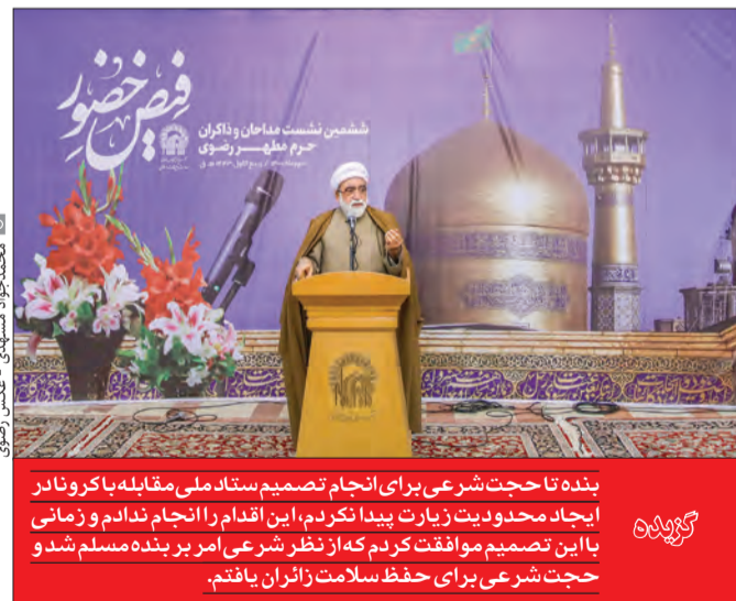
بنده تا حجت شرعی برای انجام تصمیم ستاد ملی مقابله با کرونا در ایجاد محدودیت زیارت پیدا نکردم، این اقدام را انجام نادم و زمانی با این تصمیم موافقت کردم که از نظر شرعی امر بر بنده مسلم شد و حجت شرعی برای حفظ سلامت زائران یافتم.

تولیت آستان قدس رضوی با تأکید بر این مطلب که در ایام محدودیت زیارت به طور مستمر با ستاد ملی مقابله با کرونا و دستگاه های مربوط در تماس و تلاش بودیم تا به هر میزان که امکان دارد شرایط زیارت را برای زائران فراهم آوریم، به ایام تعطیلی حرم مطهر در نوروز ۹۹ اشاره و عنوان کرد: به ستاد ملی مقابله با کرونا اعلام کردیم هر امکاناتی از دستگاه های