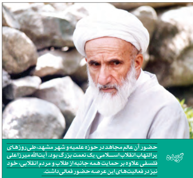
حضور آن عالم مجاهد در حوزه علمیه و شهر مشهد، طی روزهای پرتلاطم انقلاب اسلامی، یک نعمت بزرگ بود. آیت‌الله میرزاعلی فلسفی علاوه بر حمایت همه‌جانبه از طلاب و مردم انقلابی، خود نیز در فعالیت‌های این عرصه حضور فعالی داشت.

آیت‌الله میرزاعلی فلسفی تا سال ۱۳۴۰ در نجف اشرف به فعالیت‌های علمی خود ادامه داد. در این سال، با درگذشت شیخ علی‌اکبر برهان، امام جماعت و معلم