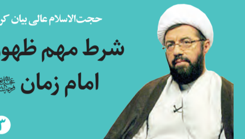
حجت‌الاسلام عالی بیان کرد

ویژه فرهنگ و معارف رضوی | سال اول | ویژه نامه ۱۷۵