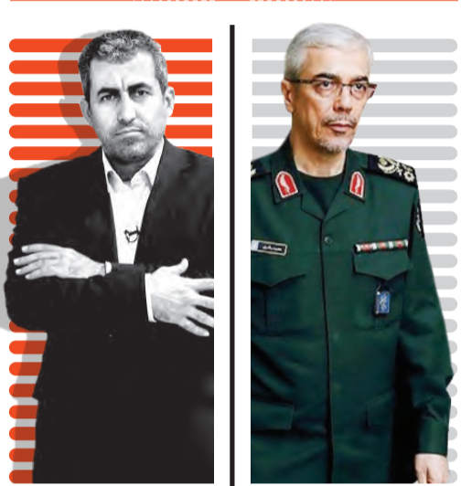
تحلیلی از سفر رئیس ستاد کل نیروهای مسلح به مسکو پرونده‌های روی میز سرلشکر