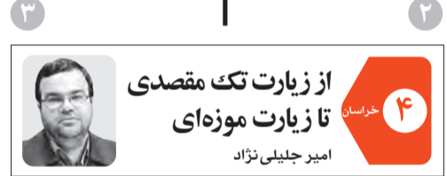
از زیارت تک مقصدی تا زیارت موزه‌ای امیر جلیلی نژاد

قدس فروش اموال مازاد را به عنوان یکی از راه‌های رفع کسری بودجه بررسی می‌کند