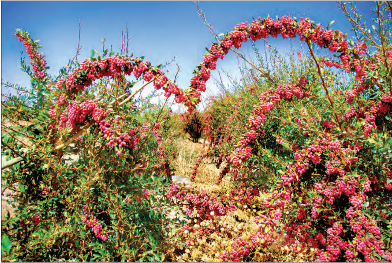
از تصویر تقدیم