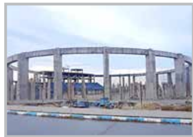
بزرگترین طرح ورزش در انتظار مساعدت است