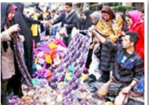
بازار واحدهای صنغی نادر.