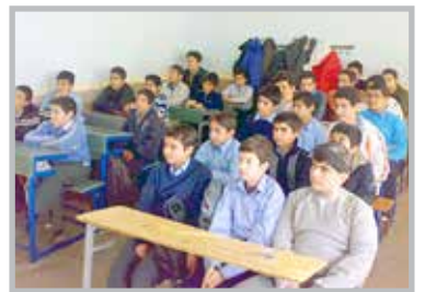
مدیرکل آموزش و پرورش: