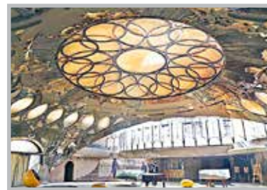
آثار باستانی در معرض تخریب قرار دارد