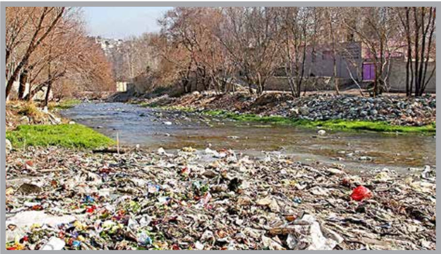
رودخانه کرج در حال خروشی