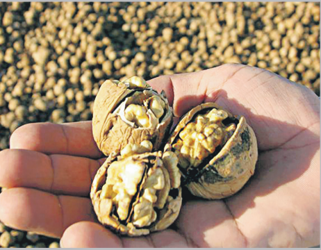
کشمیر: محسن لطفی