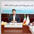
سید علی خامنه‌ای در مراسم افتتاحیه

راه‌اندازی صندوق پژوهش و فناوری خراسان شمالی در ین بیست و پنجمین روز از سفر رسمی سید علی خامنه‌ای به استان خراسان شمالی است. وی در این سفر به دیدار از مراکز علمی و پژوهشی و بازدید از واحدهای تولیدی و خدماتی استان پرداخته است.