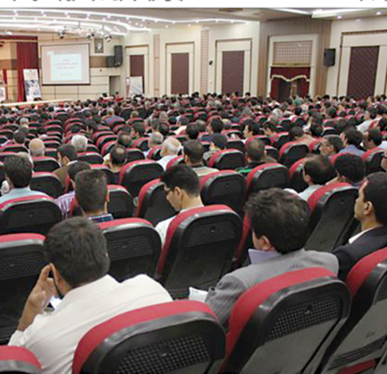
در فاز عمرانی پروژه شیشه کاویان فلوت، حدود ۲۰۰ نفر مشغول بکار می‌باشند که پس از راه‌اندازی خط تولید فلوت و خطوط تولید آینه و رفلکس بیش از ۵۵۰ نفر به صورت مستقیم مشغول به فعالیت شوند.